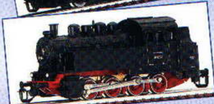
02219 Start Dampflokomotive BR 81