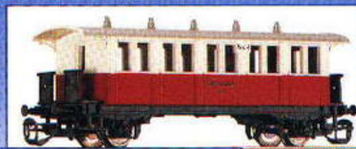
13118 Personenwagen „Kleinbahn AG“ mit offenen Bühnen