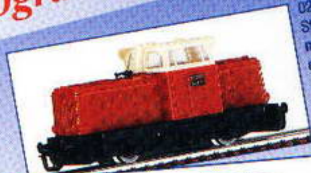
02619 Start Diesellokomotive „V 23“ für den Rangierbetrieb

Programm für alle „kleinen“ Modelleisenbahner!!!