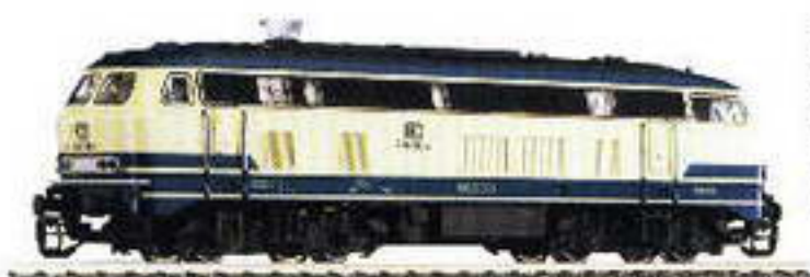
02703 Diesellokomotive BR 218 293-9 der DB, Epoche IV LüP 137 mm