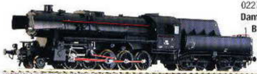
02273 Dampflokomotive BR 52 der ÖBB, Epoche III LüP 193 mm