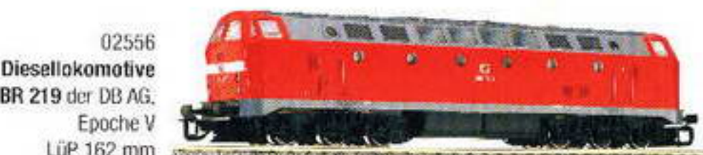
02556 Diesellokomotive BR 219 der DB AG, Epoche V LüP 162 mm

Mit TILLIG TT-Bahnen liegen Sie richtig!