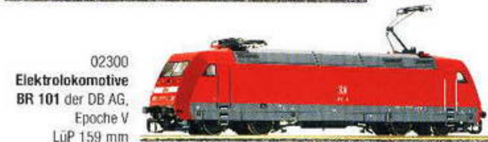
02300 Elektrolokomotive BR 101 der DB AG, Epoche V LüP 159 mm