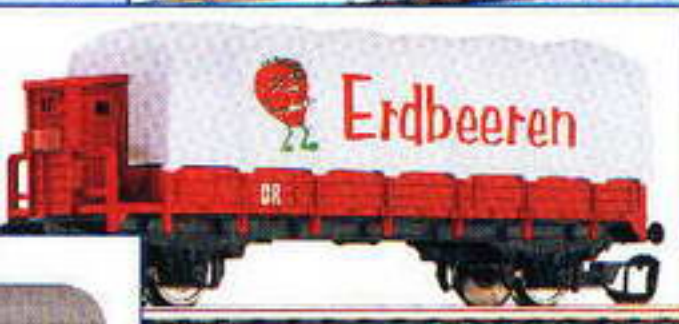
14635 Planenwagen „Erdbeeren“ (oben) 14379 Kühlwagen für Bananentransport (li.) 02229 Start Dampflokomotive BR 92 „Kleinbahn AG“ (links außen) 13206 Personenwagen „Blue Train“ mit offenen Bühnen (rechts)